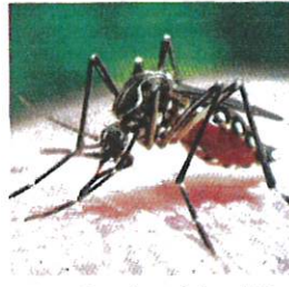
DEMAM denggi merebak melalui gigitan nyamuk Aedes.

matian denggi telah direkodkan termasuk tiga kes di PK Lembah Pantai.