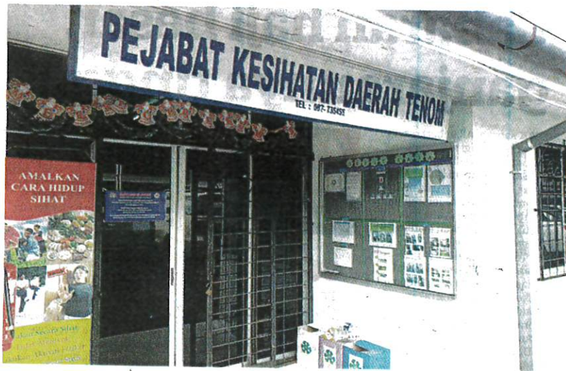
PEJABAT Kesihatan Daerah Tenom mula mengenal pasti peningkatan kes AGE pada 4 Jun lalu.

AKHBAR : KOSMO MUKA SURAT : 9 RUANGAN : NEGARA