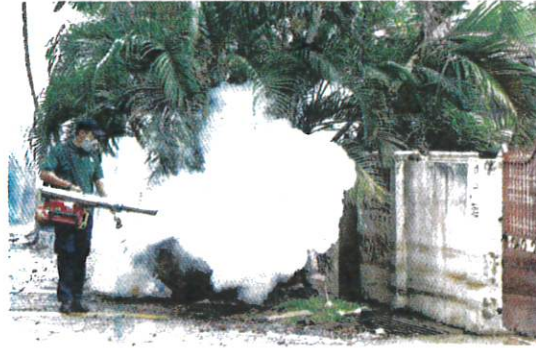
ORANG ramai dinasihatkan untuk menghapuskan tempat pembiakan nyamuk Aedes di kawasan masing-masing.

denggi ini berlaku kerana beberapa faktor antaranya disebabkan bangunan berstrata tinggi yang ada di sekitar ibu kota dan Putrajaya.