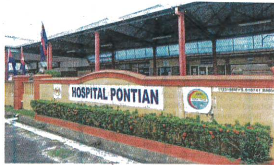
HOSPITAL Pontian yang sudah berusia 100 tahun memerlukan penambahan katil dan kemudahan lain bagi manfaat penduduk.

Tambah Ahmad yang juga Ahli Parlimen Pontian, projek tersebut perlu bagi daerah ini yang dianggarkan mempunyai seramai 230,000 penduduk bagi menikmati kemudahan kesihatan lebih baik.